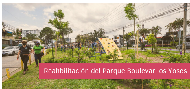
Rehabilitación del Parque Boulevard los Yoses