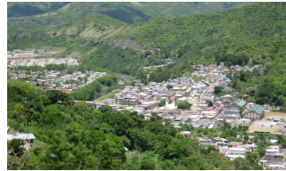
Comerío Puerto Rico