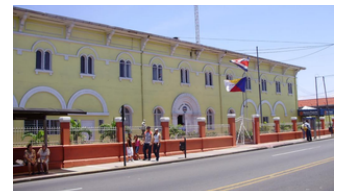
Goicoechea Costa Rica