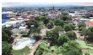
Moravia Costa Rica