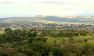
Tilarán Costa Rica