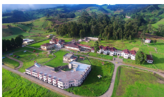
Oreamuno Costa Rica