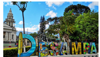
Desamparados Costa Rica