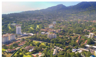
Escazú Costa Rica