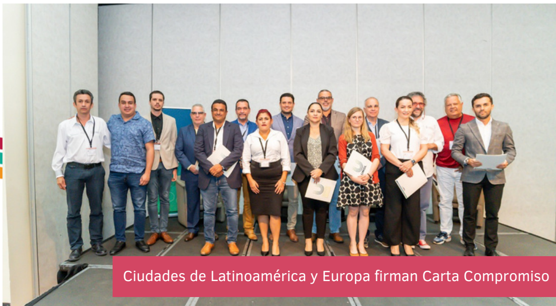
Ciudades de Latinoamérica y Europa firman Carta Compromiso

Se reflexionó sobre los aprendizajes que cada caso aporta. En su conjunto se evidenció que el impacto más eficaz se logra cuando se realizan intervenciones tanto ambientales como sociales, cuando se involucra a la población en el trabajo de la autoridad local y se trabaja de manera colaborativa con diversos actores.