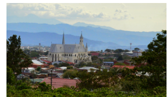
San Rafael Costa Rica