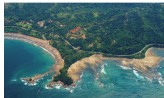
Jiménez Costa Rica