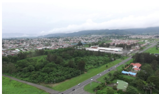
Guarco Costa Rica