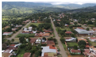
Buenos Aires Costa Rica