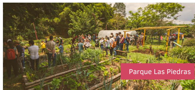
Parque Las Piedras