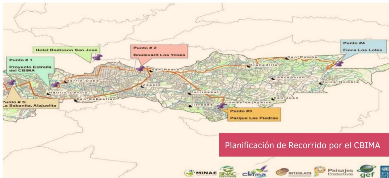
Planificación de Recorrido por el CBIMA

Otro ejemplo es el proyecto de jardinería urbana Parque las Piedras . Este espacio permite a los residentes entrar en contacto con la naturaleza y su comunidad, brindando un hábitat adecuado para aves e insectos, como las abejas, y reduciendo los gastos de alimentación de las familias involucradas en la jardinería.